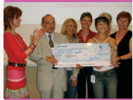
> PAGE 2 Remise du prix Any d'Avray à Eurocancer 2005