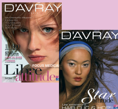
Les deux nouvelles parutions de la rentrée. Demandez-les dès maintenant !

La communication Any d'Avray évolue vers des magazines thématiques pour mieux s'adapter aux attentes spécifiques de chaque type de clientèle