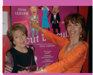
> PAGE 3 Au théâtre ce soir avec un groupe d'infirmières