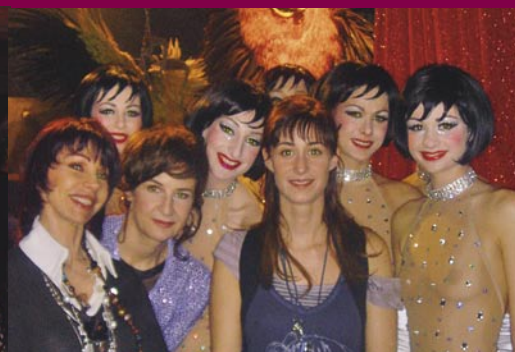
1 : Gérard Lanvin. 2 : Géraldine Pailhas. 3 : Emmanuelle Béart. 4 : Valérie Lemercier. 5 : Claude Brasseur et Danielle Thompson. 6 : Miou-Miou. 7 : Catherine Deneuve. 8. Valérie Lemercier et les comédiennes du cabaret le "Perroquet bleu".